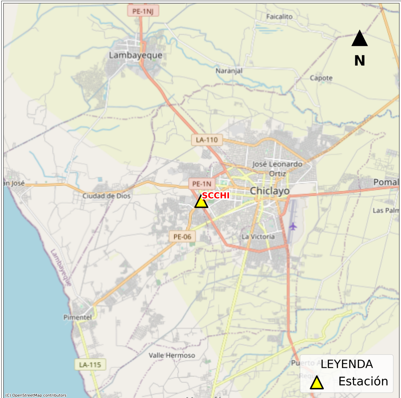
Figura 2: Mapa de ubicación de la(s) estación(es) acelerográfica(s) correspondiente(s) al Sismo de Sechura, Sechura - Piura del 13 de julio de 2023 a las 14:33:12 (hora local)