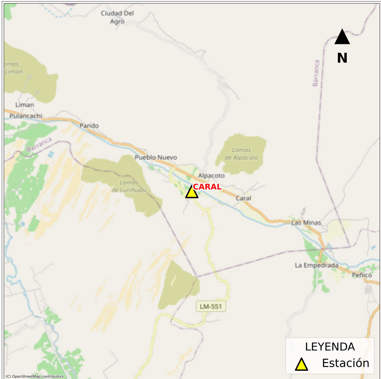
Figura 2: Mapa de ubicación de la(s) estación(es) acelerográfica(s) correspondiente(s) al Sismo de Codo del Pozuzo, Puerto Inca - Huánuco del 06 de abril de 2026 a las 11:01:17 (hora local)