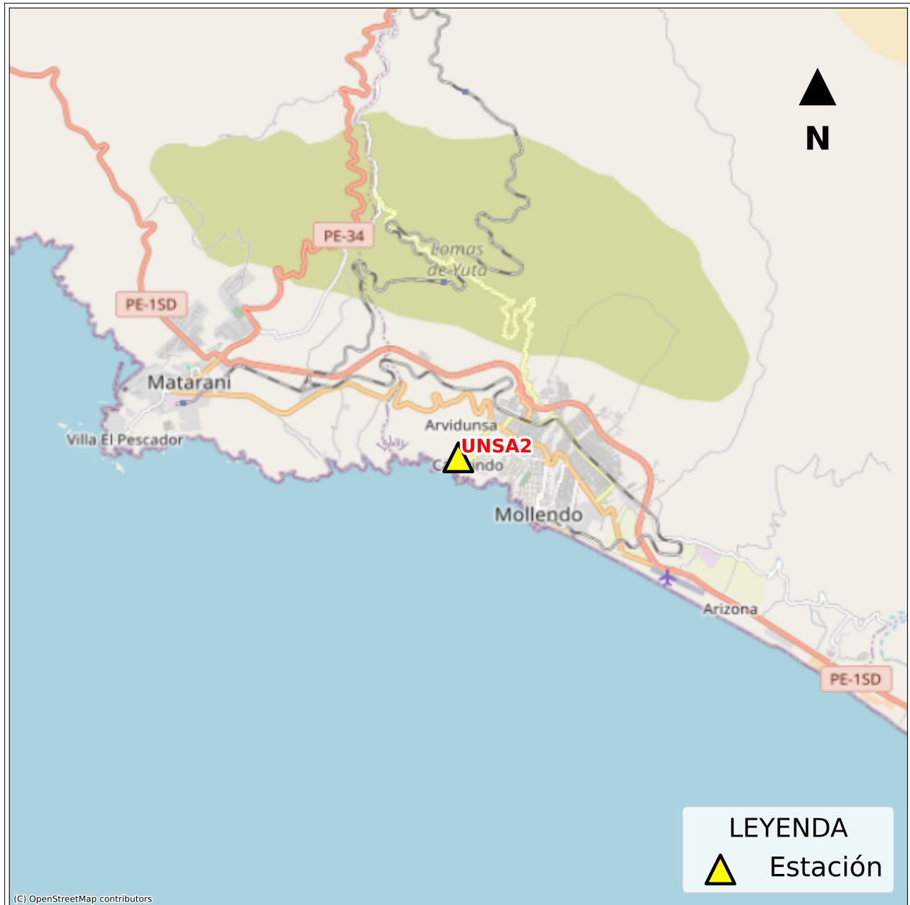
Figura 2: Mapa de ubicación de la(s) estación(es) acelerográfica(s) correspondiente(s) al Sismo de Ilo, Ilo - Moquegua del 24 de abril de 2026 a las 11:18:19 (hora local)