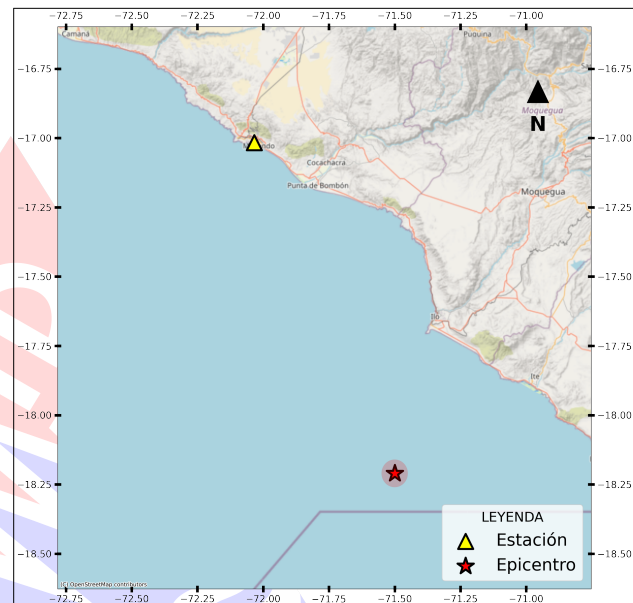
Figura 1: Ubicación del epicentro y estación(es) acelerográfica(s)

En este informe, el Centro de Observación para la Ingeniería Sísmica (CEOIS) del CISMID-FIC-UNI presenta los registros acelerográficos obtenidos en 01 estación(es) correspondientes a la Red Acelerográfica del Centro de Investigación en Transformación Digital en Ingeniería (CITDI) - Unidad de Posgrado de la FIC-UNI. Los valores de aceleración máxima (PGA) para cada componente (direcciones EO, NS y vertical) y ubicaciones geográficas, se muestran en la Tabla 2 y Figura 2 , respectivamente.